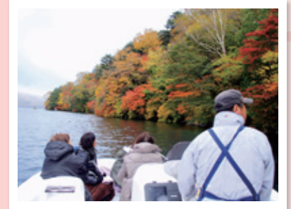
中禅寺紅葉ツアー (奥日光小西ホテル)