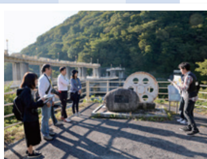
元祖黒部ダムツアー(Kuriyama Go Travel)