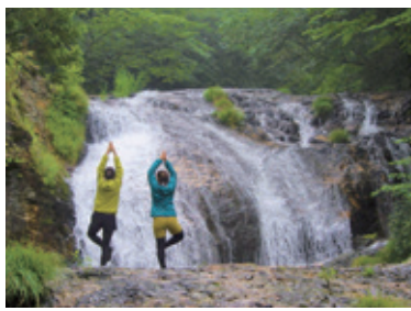
日光紅葉トレッキング&絶景ヨガツアー (One Play-it (ワンプレート))