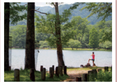
奥日光ショートハイキング&teatime (有限会社自然計画)