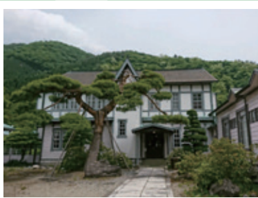
鉦都迎賓館解説、足尾の山々を再生 (足尾まるごと井戸端会議)