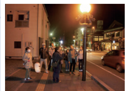
日光ぶらり～まちなかナイトウォーク～ (NPO法人日光門前まちづくり)