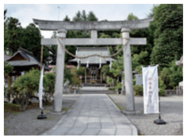
市街地観光コース (日光市シルバー人材センター)