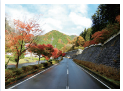
歴史探訪コース (鬼怒川温泉観光ボランティアガイドの会)