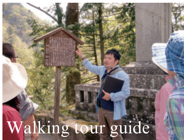
Walking tour guide