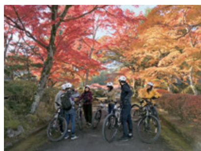
DISCOVER NIKKO サイクリングツアー (NAOC)