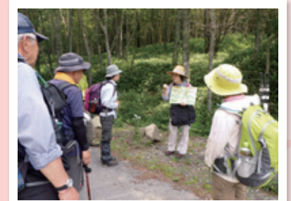
世界遺産を見渡す 外山ハイキング (一財)自然公園財団日光支部